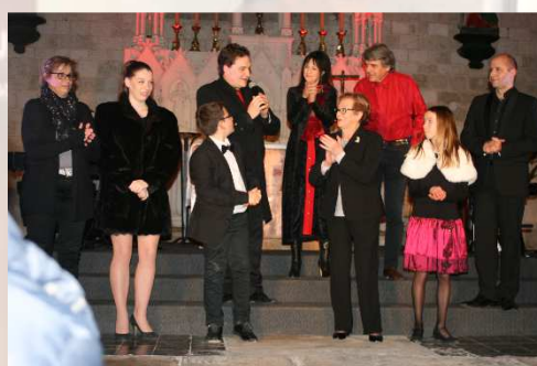
L'ensemble du groupe musical