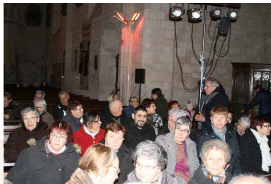
La présence de la Maison saint Paul