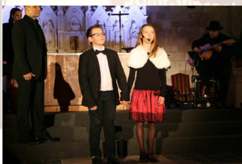
2 enfants du groupe qui chantent Noël